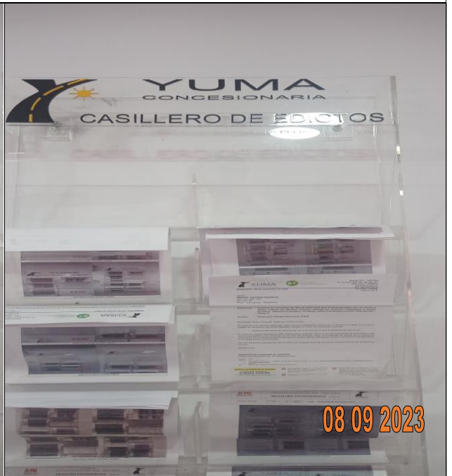
EDICTO R_37895 YC-CRT-130656